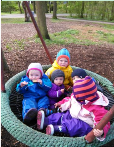
På legepladsen i parken